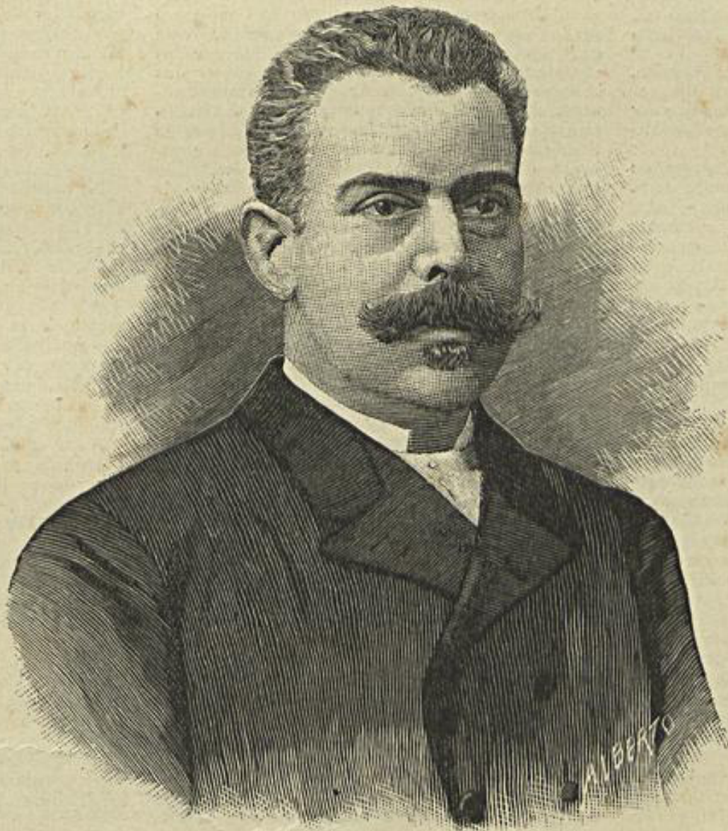
CONDE DE S. MIGUEL, NOVO MINISTRO DE PORTUGAL NA CORTE DE MADRID

Não é isto que se tem feito, em nenhum dos circos de Lisboa. Nem nos actuaes nem nos já destruidos, se pensou nunca nas exigencias de theatro: fez-se um palco por fazer, para se dizer