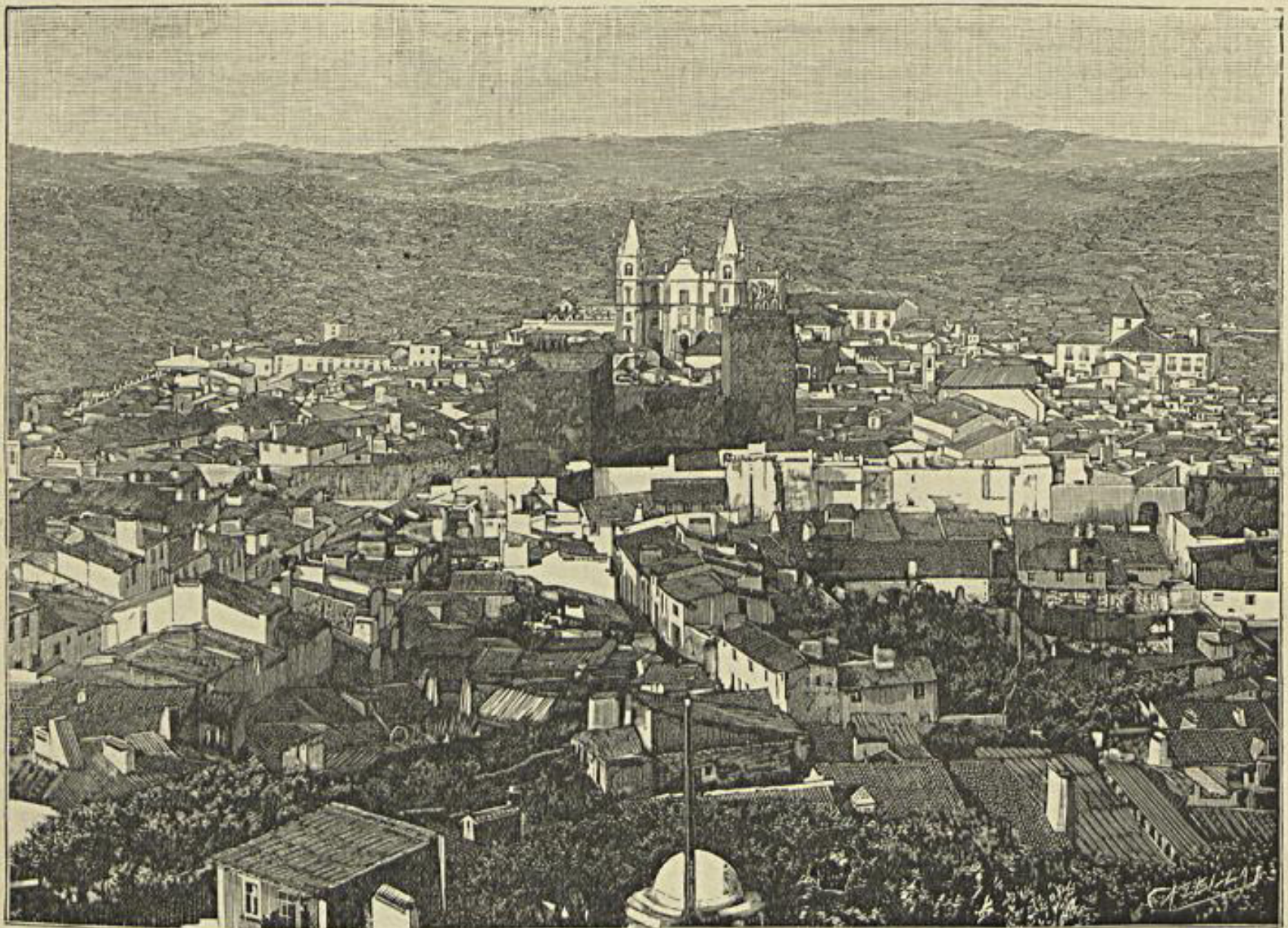
UMA VISTA DE PORTALEGRE — Vid. art. Oito dias no Alemtejo

«Poucos podem hombraer com elle e disputar-