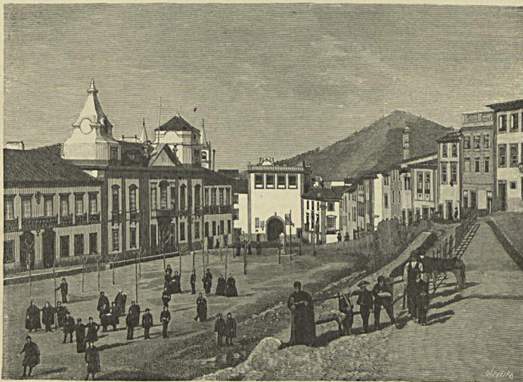
PORTALEGRE — LARGO «SERPA PINTO», LYCEU E GOVERNO CIVIL — Vid. art. Oito dias no Alemtejo

Assim, a nossa rota, já era uma pequena victoria.