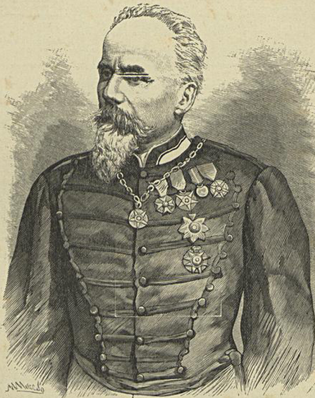
VISCONDE DE PONTE FERREIRA — FALLECIDO EM 19 DE JUNHO DE 1892

Oh ! as eleições são o grande motor dos que aspiram viver á custa do orçamento, pelo que se não houvera eleições não estaria o pobre orçamento ajoujado com ellas que faz como o camello, cospe fóra por não poder com a carga